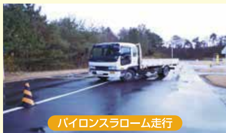
パイロンスラローム走行

主旨はドライビングフォームの矯正です。正しいドライビングフォームとハンドル操作を理解します。